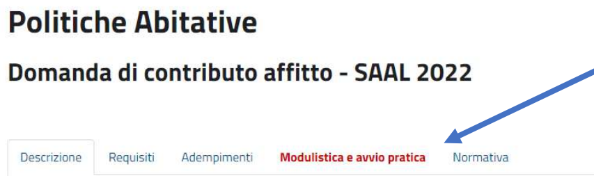
Fig. 5 – Stralcio I Pagina Compilazione Domande

-Allegato A_Guida operativa domanda SAAL 2022-