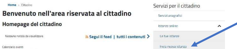
Fig. 3 – Stralcio Schermata Area Riservata al cittadino