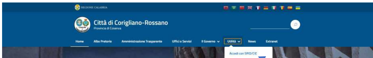
Fig. 1 – Stralcio Pagina Home del Sito

-Allegato A_Guida operativa domanda SAAL 2022-