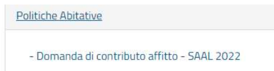
Fig. 4 – Stralcio Schermata “Politiche Abitative”